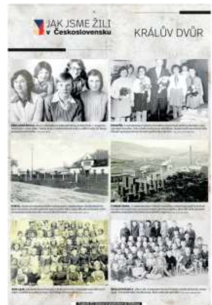
Foto popis| ROK 1918. Základní škola Počaply v Králově Dvoře. V té době byly děti ve třídách rozděleny podle pohlaví. Na fotografii jsou dívky.

Foto popis| SOKOL . Budova královského sokola byla v padesátých i šedesátých letech minulého století centrem sportovního dění. Jako děti do ní chodili cvičit už současní královští i berounští důchodci.