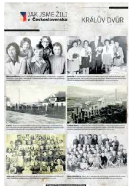
Foto popis| ROK 1918. Základní škola Počaply v Králově Dvoře. V té době byly děti ve třídách rozděleny podle pohlaví. Na fotografii jsou dívky.

Foto popis| SOKOL . Budova královského sokola byla v padesátých i šedesátých letech minulého století centrem sportovního dění. Jako děti do ní chodili cvičit už současní královští i berounští důchodci.