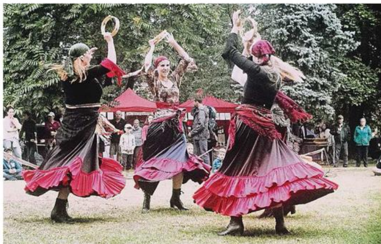
BAROKO KAŽDÝ ROK V ZÁŘÍ SI SMEČNO PŘIPOMÍNÁ SVÉ POVÝŠENÍ NA MĚSTO. SLAVNOSTI SE NESOU V BAROKNÍM DUCHU.

Město se snaží, aby se zde občanům dobře žilo. Máme zde všechny nezbytné