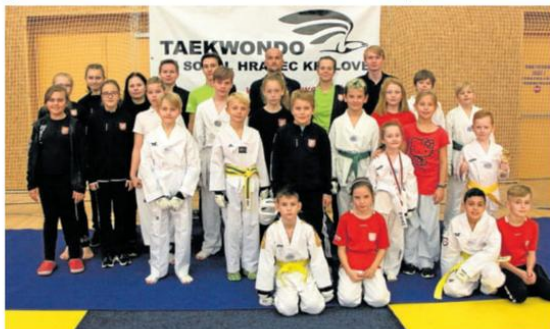
ÚSPĚŠNÍ TAEKWONDISTÉ TJ Sokol Hradec Králové dosáhli dobrých výsledků.

S průběhem jsem byl maximálně spokojen. Organizace byla super, za to patří velký dík rodičům dětí, kteří nám pomáhají. Také naši trenéři byli bezkonkurenční. Ale na druhou stranu, co si neuděláme sami, to nemáme. Účast byla po několika letech slabší. Náš podnik patří dlouhodobě mezi nejlepší turnaje v České republice. Jsme zařazení do TEM (Taekwondo extraliga mládeže) a NTLM (Národní taekwondo liga mládeže), což je seriál několika českých turnajů, kde sportovci sbírají za svá umístění body a na konci roku je vždy vyhlášen celko-