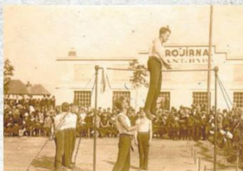
OTEVŘENÍ SOKOLOVNY. Cvičenky a cvičenci předvedli na cvičišti veřejné vystoupení. Žáci, žákyně, dorostenci i dorostenky tam zacvičili nápaditá prostrná. Milevská jednota předvedla cvičení na nářadí, župní družstvo žen cvičení s koulemi a župní družstvo mužů zacvičilo na bradlech.